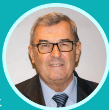
Le Président Jean-Paul Bacquet

Il s'agit d'un programme incitant à l'amélioration et la réhabilitation de logements en milieu rural ou urbain. C'est donc un dispositif territorialisé destiné à l'amélioration de l'habitat privé.